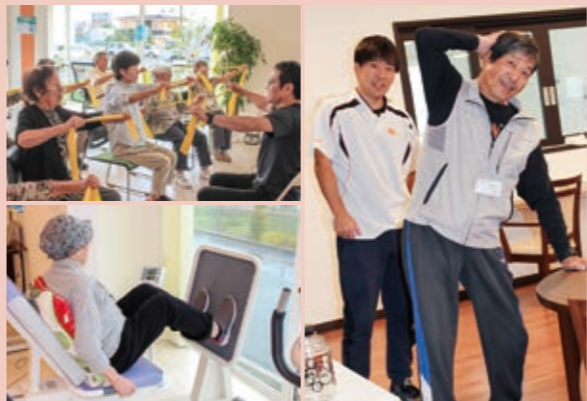
右/理学療法士による個別機能訓練。左上/椅子に座って楽しみながらできる集団ストレッチ。左下/マシンを使ったレッグプレスで大腿部をトレーニングし歩行を安定させます