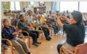
上/集団ストレッチ。下/イーストライダー