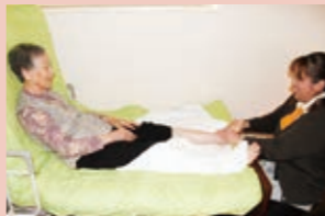
上/ネイルケア。下/フットマッサージ