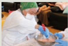
さくらもちづくり