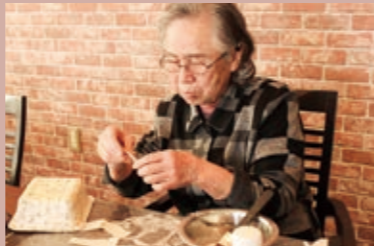
一閑張りは和紙を何度も張り重ねて形を作っていきます

滑 川町にオープンして6年目を迎えました。カフェスタイルをコンセプトに、大人のデイサービスを追求し本格的な趣味活動を提供しております。フラワーアレンジメント、俳句、一閑張り、絵手紙、押し花、木目込みパッチワーク、ステンドグラス、陶芸等、多彩な創作活動を通じて、ご利用者様の意欲向上や新たな生きがいづくりを支援いたします。また、フィットネスルームでは講師によるピラティスや棒体操等を行い、運動面の向上もサポート。体を動かしたあとのクールダウンには、リラクゼーションルームにてアロマで癒しを感じながら、資格をもった職員によるフットケアで心身ともにリラックス。さらなるご満足をお届けします。