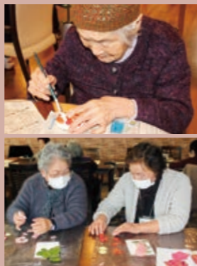
上/送る人に思いを込めながら描く絵手紙。下/お友達とおしゃべりを楽しみながら押し花をしています

滑 川町にオープンして6年目を迎えました。カフェスタイルをコンセプトに、大人のデイサービスを追求し本格的な趣味活動を提供しております。フラワーアレンジメント、俳句、一閑張り、絵手紙、押し花、木目込みパッチワーク、ステンドグラス、陶芸等、多彩な創作活動を通じて、ご利用者様の意欲向上や新たな生きがいづくりを支援いたします。また、フィットネスルームでは講師によるピラティスや棒体操等を行い、運動面の向上もサポート。体を動かしたあとのクールダウンには、リラクゼーションルームにてアロマで癒しを感じながら、資格をもった職員によるフットケアで心身ともにリラックス。さらなるご満足をお届けします。