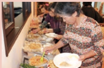
デザートバイキング